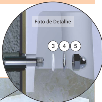
Foto de Detalhe

Insira a bucha (item 1) do seu kit de instalação que acompanha o produto e em seguida insira o parafuso (item 2) deixando 4 cm para fora da parede para a fixação do lavatório.